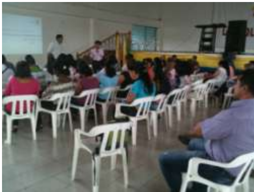
Encuentro de Docentes y Directivos – Municipio de Miranda.

Encuentro de Concertación de Modalidades – Secretarios de Educación / Jefes de Núcleo / Talleristas y Tutores.