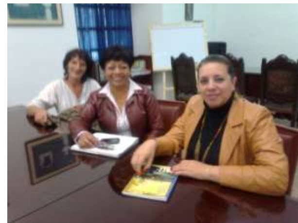
Vicerrectora de la Universidad del Cauca.