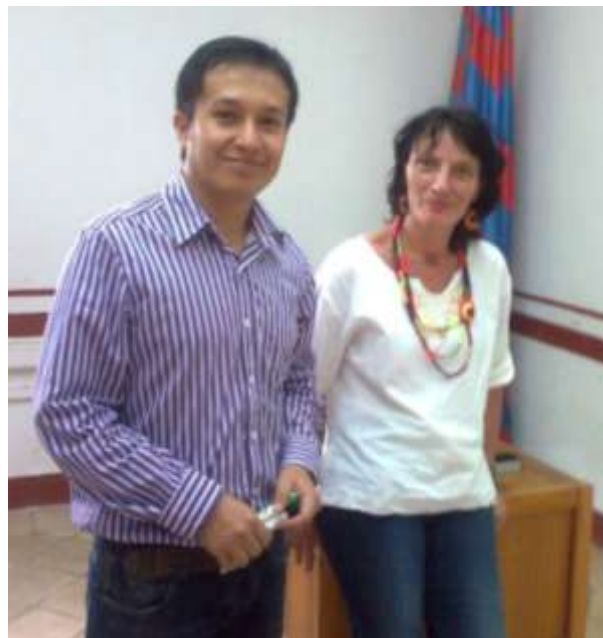
Representante de la Universidad Indígena